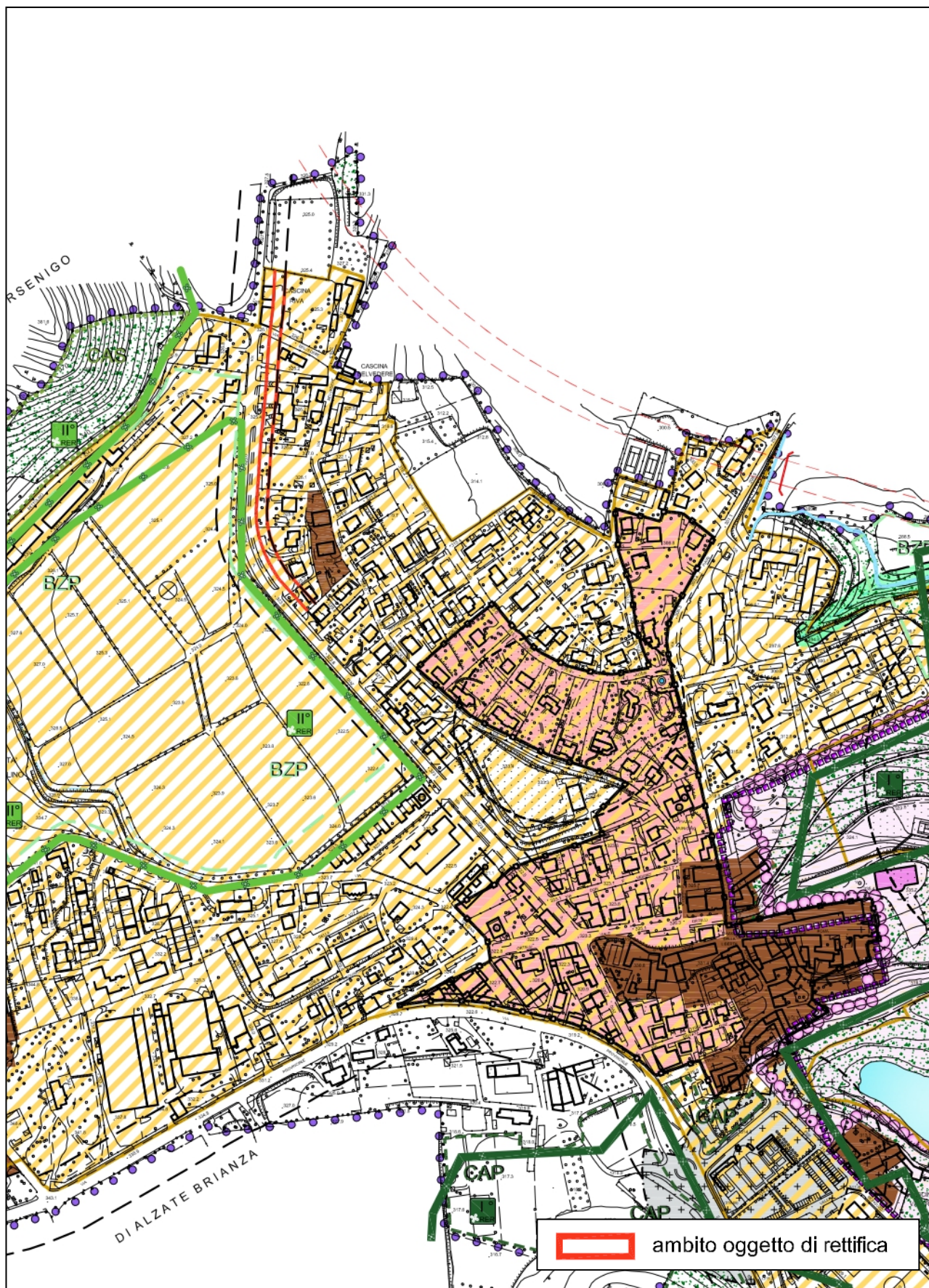
Tav.5 "Carta dei Vincoli" - Stralcio elaborato vigente con ambito oggetto di rettifica

Comune Anzano del Parco Prot. 0001008 del 06-02-2024 arrivo Cat. 6 Cl. 1 fasc 1